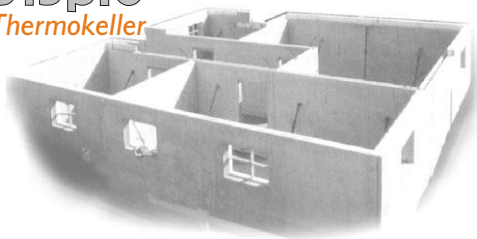
Das modernste Kellerbau-System am Markt

Das Ergebnis: Ein ausgereiftes Kellerbau-System, das ärgerliche Baufehler, Terminverzögerungen und teure Folgeschäden nicht mehr zuläßt. Dazu mit einer integrierten Technik, die so perfekt und präzise auf der Baustelle nicht gebaut werden kann.